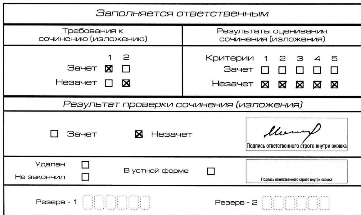
Рис. 7. Область для оценки работы

Если итоговое сочинение (изложение) соответствует требованию № 1 и требованию № 2, то выставляется «зачет» за выполнение требования № 1 и требования № 2. Указанные сочинения (изложения) далее оцениваются по критериям.