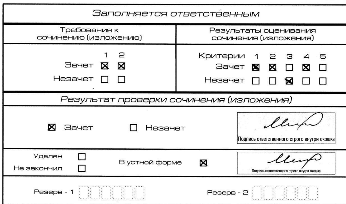
Рис. 9. Область для оценки работы сочинения (изложения) в устной форме

подпись в специально отведенном для этого поле.