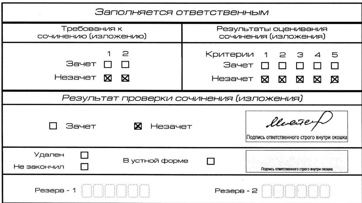
Рис. 6. Область для оценки работы